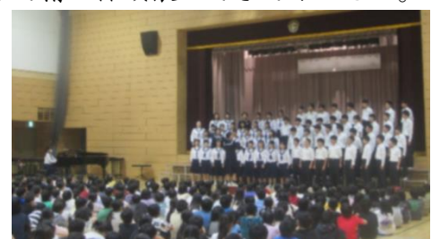
【下新倉小での交流】

学校の様子や生徒達の活躍する姿は、これからも 本校HP『大和中ダイアリー』にて随時更新しておりますので、ご覧いただくと幸いです。