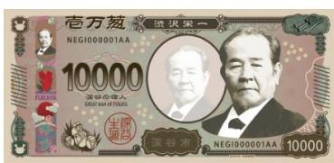
深谷市 渋沢栄一 ロゴマークより

さて、7月3日には、20年ぶりに新しい紙幣が発行されます。肖像画は新千円札が北里 柴三郎氏、新五千円札が津田 梅子氏、新一万円札が渋沢 栄一氏です。渋沢氏をご存じの通り、埼玉の三大偉人と言われています。深谷市で生まれ、江戸の幕末・明治・大正・昭和のはじめを生き、生涯に約500もの企業の設立と育成に携わり、約600の社会公共事業、福祉・教育機関の支援や民間外交に尽力しました。3年前に放送された大